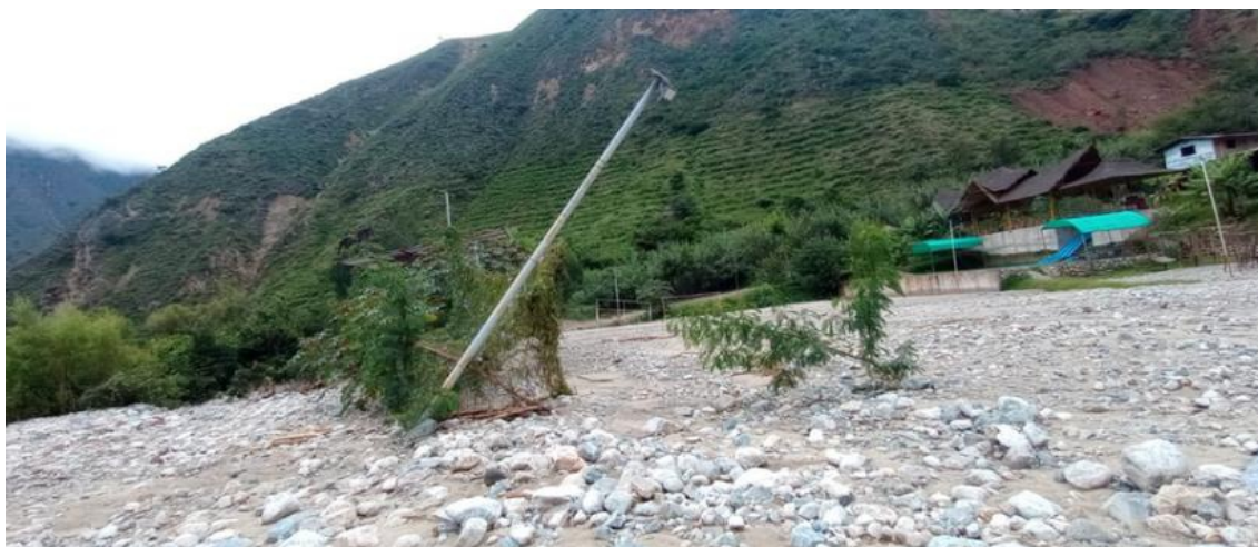
FIGURA N°03: EN EL FINAL DEL TRAMO DE LA QUEBRADA HA AFECTADO A LAS VIVIENDAS Y CULTIVOS AGRÍCOLAS