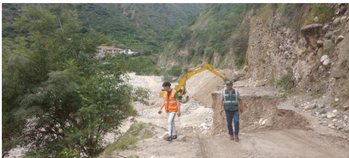
FIGURA N°02: EN EL RECORRIDO SE OBSERVA QUE EL RIO, EN SU MARGEN DERECHA VIENE AFECTADO PARTE DE LA CARRETERA TOTALMENTE DESTRUIDA