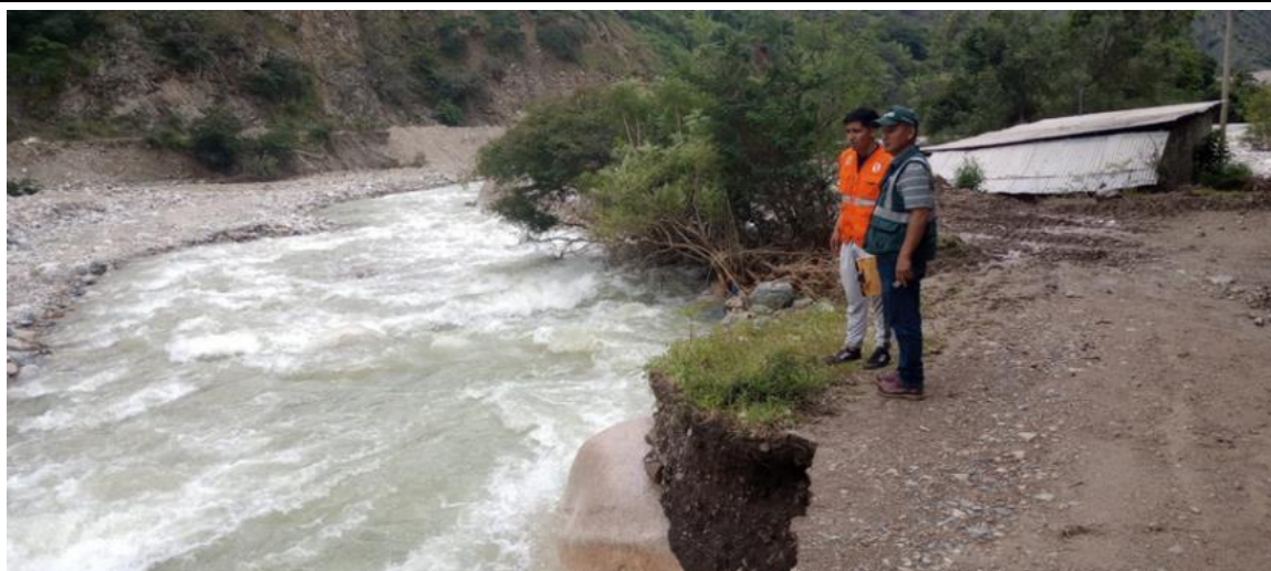
FIGURA N°01: RECORRIDO E IDENTIFICACION DE TRAMOS CRÍTICOS DESDE EL PUNTO DE INICIO, DONDE SE PUEDE VISUALIZAR QUE LA QUEBRADA EN SU MARGEN DERECHA AFECTADO A VIVIENDAS Y PARTE DE LA CARRETERA DESTRUIDA.